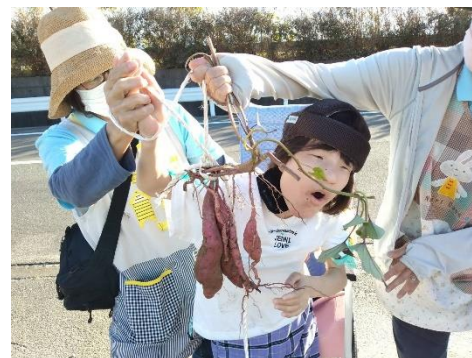
お～大きなお芋が入ってるよ!