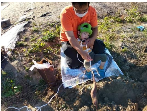
お芋ほり第2弾、よいしょ!

ハロウィンパーティ、コスプレとっても楽しかったよ。みんなの笑顔、えがお、エガオ・・・(^^)