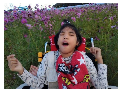
周船寺コスモス園にて